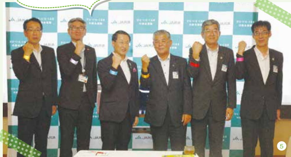
3) 反射付エコショッピングバッグ 4) 反射3Dリストバンド 5) 寄贈式

このリストバンドを身につけておくことで夜道でも気付いてもらえるようになり、とても役立っています。