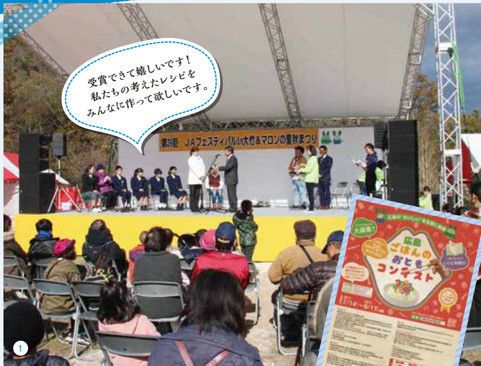
1) ごはんのおともコンテスト表彰式 2) 広島ごはんのおともコンテスト開催チラシ