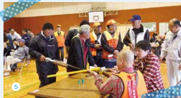
3) 模擬シューティング体験 4) 鳥獣被害防止技術パネル展示 5) 模擬銃展示