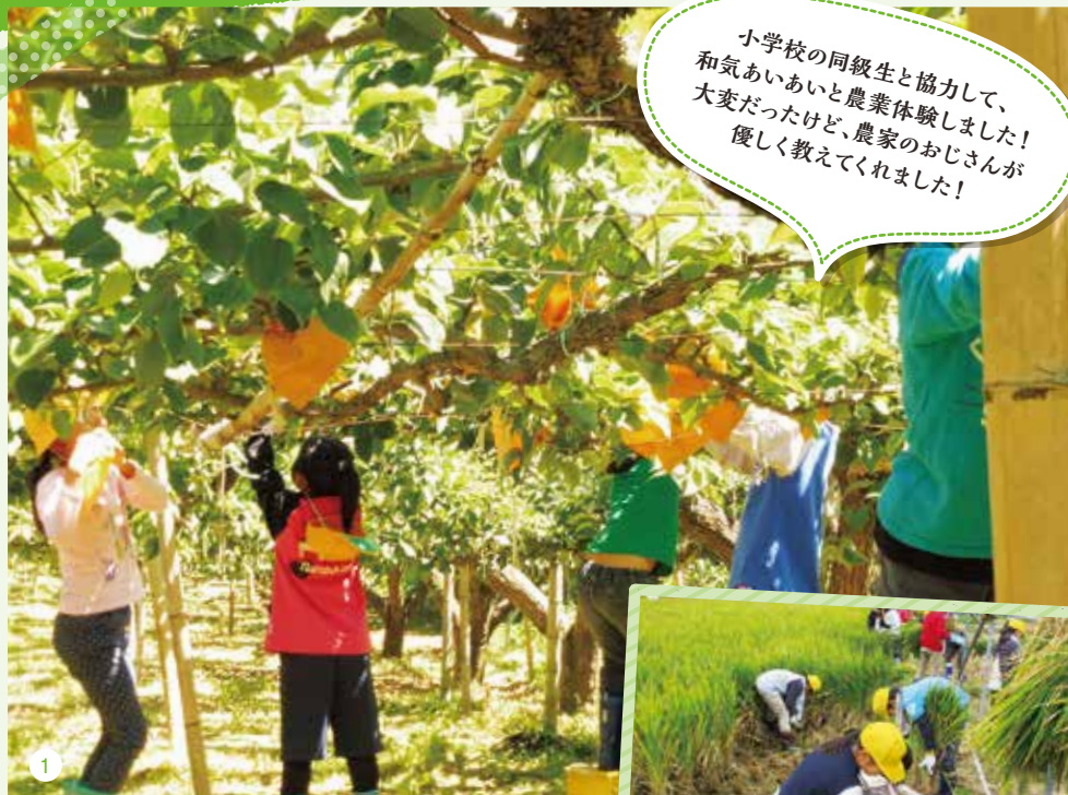
1) 小学3年生 「梨作り体験」 2) 小学5年生 「米作り体験」