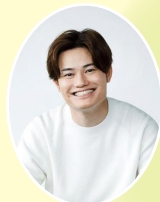
てい先生 育児アドバイザー

てい先生が子どもたちと実際に道路を歩きながら、 具体的に通学路の確認ポイントを解説。 動画でわかりやすく学べます。