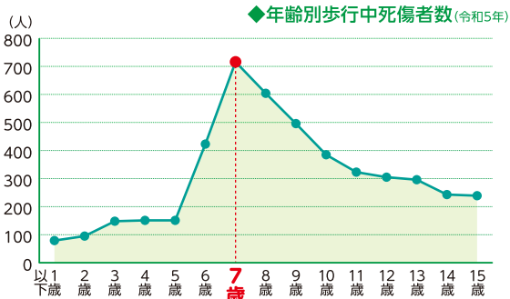
各歳別歩行中死傷者数の推移(交通事故総合分析センター)より作成