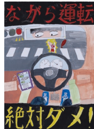
安平町立 早来学園 6年 真保 妃希