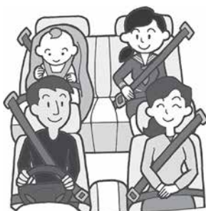
図例3 シートベルトの描き方