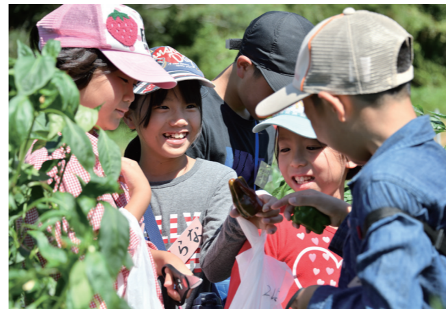
暑さも忘れておいしいオクラを探す男の子