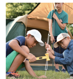
宿泊場所となるテントを協力合って設営する