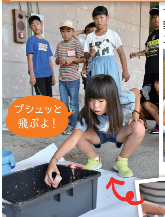
プシュッと飛ばよ!