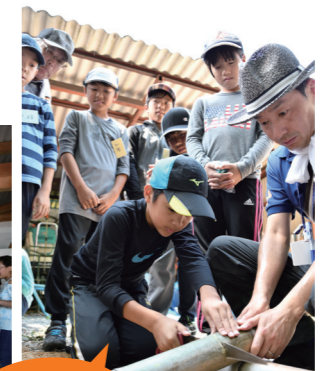
大工仕事って結構楽しい!