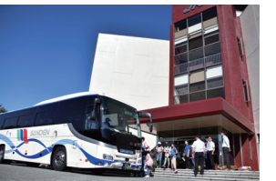
バスに乗って 出発!

JA共済連はJAとともに、組合員・地域住民のみなさまが安心して暮らせる地域社会を目指し、地域貢献活動に取り組んでいます。今回は12月号から4回にわたり、各都道府県本部が地域の特性を活かして取り組む独自の地域貢献活動についてご紹介します。