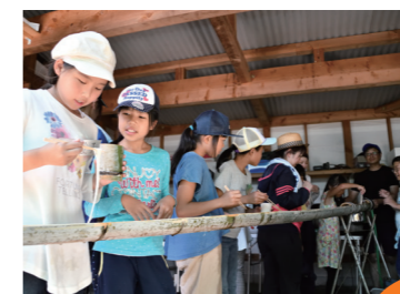
流しそうめんが初体験の子も多く、流れるたびに歓声上がる

農業と地域の魅力を伝える子どもたちが主役の二日間 JA山口宇部では、平成二十九年頃から地元の子どもたちを対象に、「夏休み子ども村体験ツアー」を開催。JA自己改革の取り組みの一環として組合員地域対策課を新設し、組合員・地域住民との関係強化を目指すなかで、子どもたちが農業や自然と触れ合い、地域とのつながりづくりを行うことを目的に実施しています。当日は小学四～六年生の子どもたち三十一人が親元を離れ元気に参加。地元生産者の畑での野菜の収穫体験を終えた後は、竹で器を作り、流しそうめん大会に。「自然の中で食べる」といつもよりおいしい!と賑やかな声が響きます。夜はテント泊のため、地元のJA青壮年部と一緒に設営にも挑戦。仲間と協力し合い、無事立派なテントが完成しました。翌日はボートに乗り込み、チーム対抗のレースで盛り上がりました。そして、午後の自由研究では、野菜の推進力を使ったフィルムケースロケット作りにもみんな夢中。「今回参加して地元の野菜や自然がもっと好きになった!」と、目を輝かせる子どもたちの笑顔があふれた二日間でした。