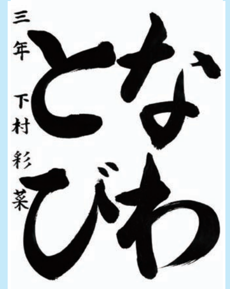
高知県・高知市立旭小学校3年

▼一筆一筆丁寧に書かれています。また、かろやかなリズムも感じられます。はじめからおわりまで集中力がとぎれることなく筆を運んでいます。紙面に対する文字のおさめかたもとても素晴らしいです。