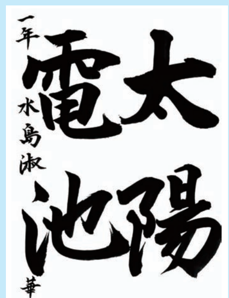
広島県・私立広島なぎさ中学校 1年

▼行書の筆づかいをすっかりマスターした見事な作品ですが、それ以上に、線がよくこなれ、豊かな心を感じます。書が大好きで、よほど沢山書いたのでしょう。