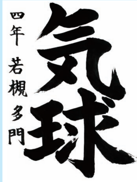
茨城県・つくば市立栗原小学校 4年

▼どっしりと、心の豊かさが伝わってくる作品で素晴らしい。難しい二字を上手に組み合わせたところも感心しました。名前も堂々として立派です。