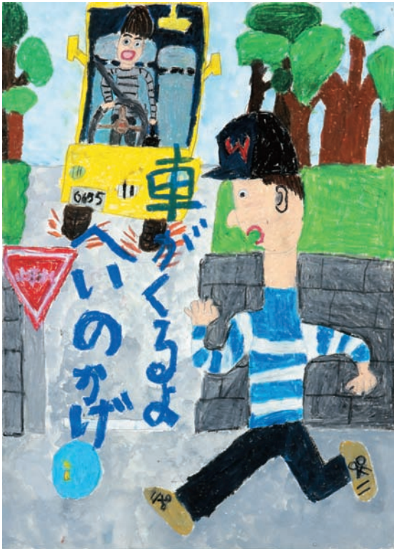
飛び出そうとする人、自動車、止まれの標識など、全体がよくまとまっています。標識の赤、人とボールの青、車の黄、木の緑もあざやかです。