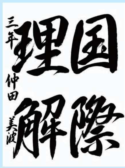
静岡県・吉田町立吉田中学校3年

▼行書の筆づかいがしっかりしていて、とてもリズムカルです。点画のつながりを感じさせる素晴らしい作品となりました。画数の多い漢字を紙面全体に実に見事におさめています。