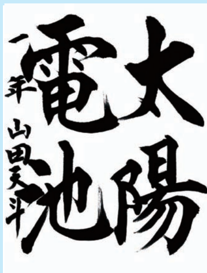
沖縄県・宜野座村立宜野座中学校1年

▼点画のすみずみまで気持ちが行き届き、細やかさを感じさせる作品となりました。充実した安定感のある書きぶり、筆勢が感じられます。紙面全体に対する文字の配列も見事です。