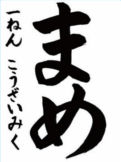
和歌山県・紀の川市立中貴志小学校1年

▼1年生とは思えない素晴らしい作品です。筆づかいがしっかりしていて、「ま」のむすび、「め」の大回りも見事です。学年と氏名もバランスを考えながらよく書けています。