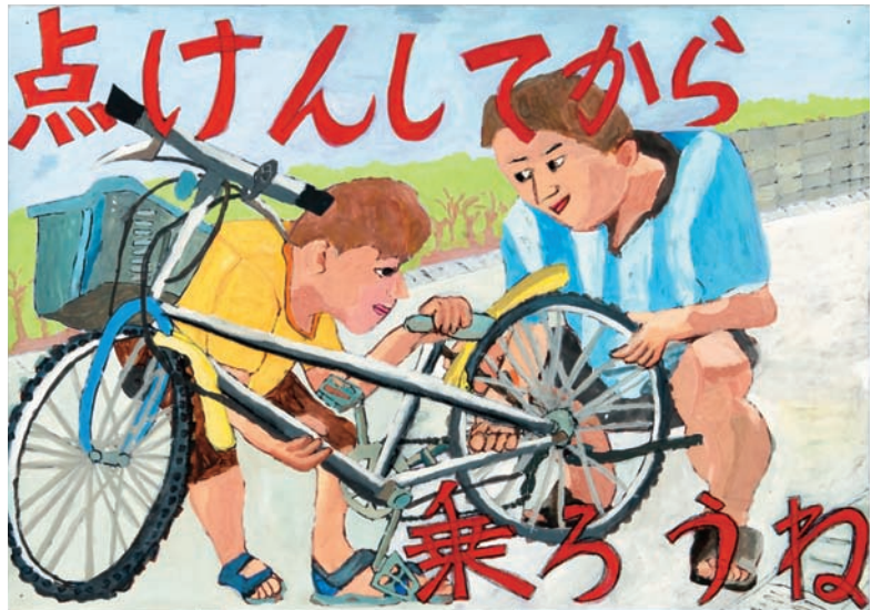
いつも自転車に楽しく乗っているのだと思います。自転車や点検をする人のすがたがよく描けています。赤い字もわかりやすくしっかり描けました。