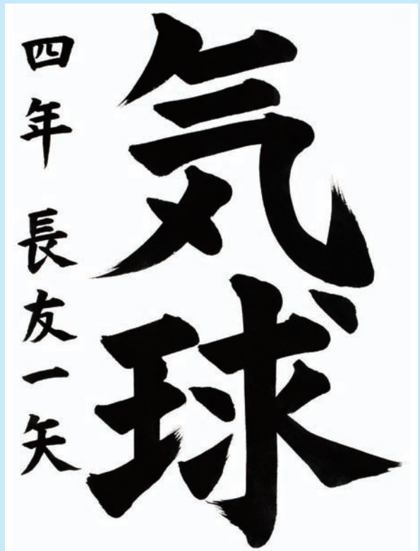
宮崎県・西都市立 妻南小学校4年

▼字形も誠に申し分なく立派で、小気味のよい線のキレ味は本当に気持ちよく、また字くばりを寸分も狂わせなかった腕前には拍手を送りたい気持ちです。