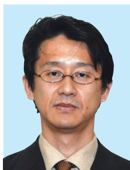
文部科学省初等中等教育局 教科調査官

このコンクールは、我が国を質、量共に代表するまさに日本一の展覧会ですからこれからも自信を持って学ばれることを期待します。