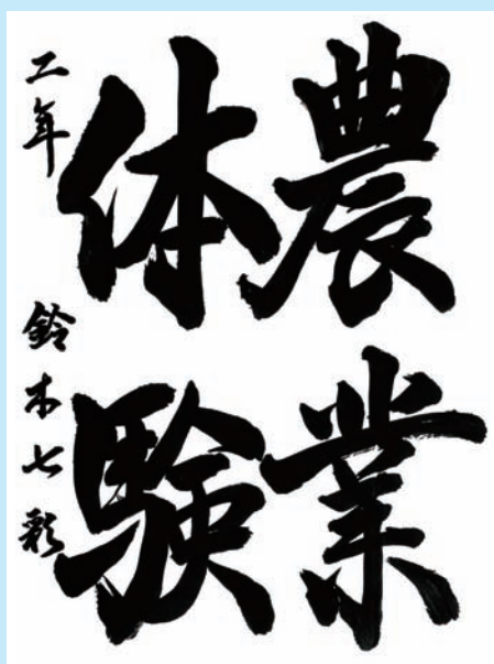
神奈川県・厚木市立林中中学校 2年

▼行書で書かれた作品ですが、線の動きを感じさせます。大きく堂々と書かれ、線の中の空間も活かされています。全体の調和がとれた好作です。