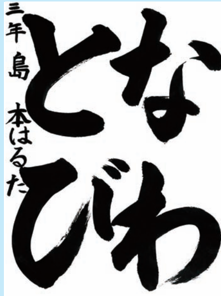
岡山県・倉敷市立赤崎小学校 3年

▼四文字のバランスがよく、生き生きと見えます。難しい字も楽々と書けています。大人でもなかなかこのように書けません。見事です。