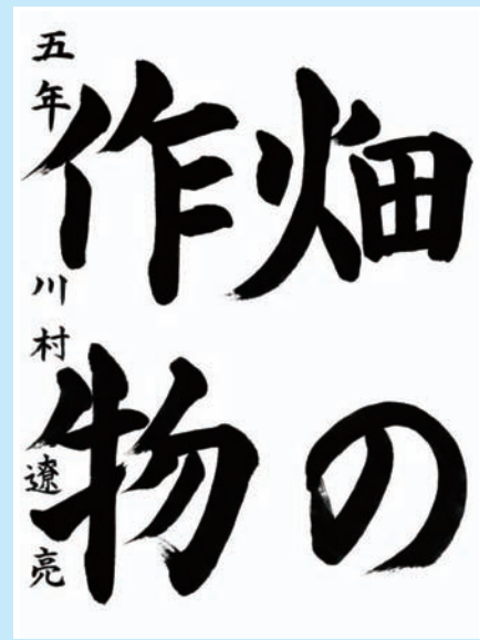
静岡県・焼津市立小川小学校5年

▼ゆったりとした筆づかいで、安定感と余裕が感じられる作品となりました。漢字と平仮名の調和も素晴らしく、紙面全体に対する文字の配列がとても良くできています。