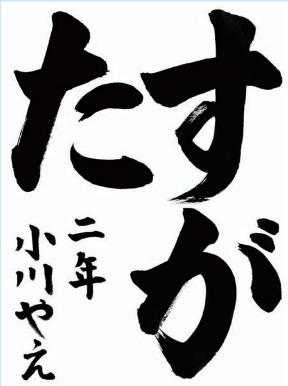
兵庫県・神戸市立 長坂小学校2年

▼この課題の通り本当に「すがた」よく書けました。すがた形ばかりでなく正しくふっくらとした線の美しさ、名前に至るまで位置よく実に立派に見えます。