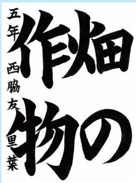
兵庫県・加西市立泉小学校 5年

▼紙面全体に、難しい文字をよく工夫して組み合わせ、大きな感じを出すことができました。筆づかいも丁寧に、まじめな人から感じます。