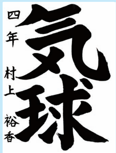
香川県・東かがわ市立誉水小学校4年

▼充実感に満ちた書きぶり、堂々とした作品に仕上がりました。空高くのぼる「気球」を思わせます。一点一画がとても安定していて、紙面全体をしっかりととらえて、見事におさめています。