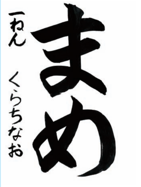
愛知県・小牧市立味噌小学校 1年

▼正しい筆づかいで、曲がるところが特に丁寧に書かれた素晴らしい作品です。名前もバランスよく書けています。これからも大いに頑張ってください。