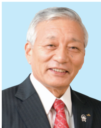
全国共済農業協同組合連合会 経営管理委員会会長