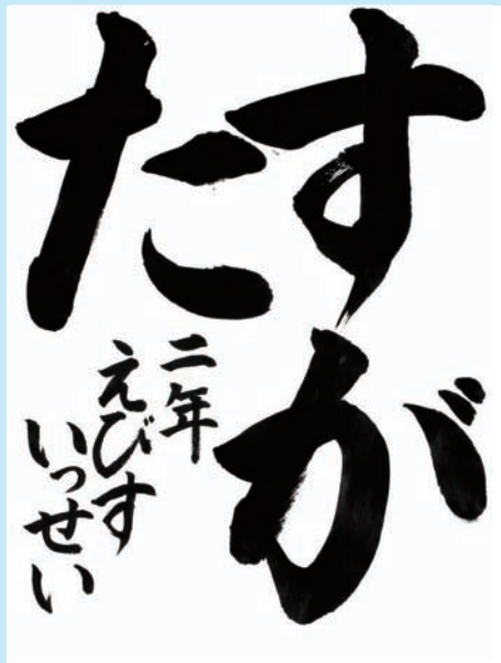
岡山県・倉敷市立味野小学校 2年

▼紙いっぱいに、堂々とたくましく書けています。線ものびのびと力強さが出て表現も大きい。名前も大変よく書けています。