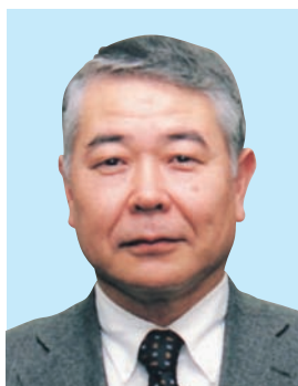
東京学芸大学教授

各地区で厳選されてきただけに各学年とも大変立派な作品でした。低学年は、紙いっぱい力強くのびのびと書かれ、高学年になると、一点一画正確に書き完成度の高い作品が多く、今後がますます楽しみになります。