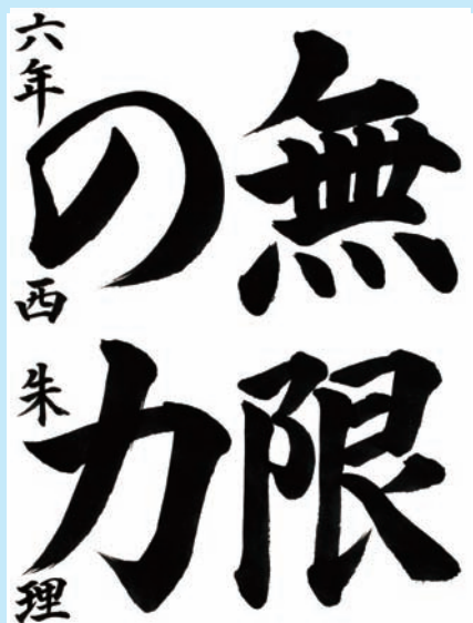
徳島県・つるぎ町立半田小学校6年

▼重厚感のある筆づかいで書かれています。一点一画に気持ちが行き届いて見事です。平仮名の「の」も堂々とした書きぶり、漢字とよく調和しています。中学生になっても続けて下さい。素晴らしい作品を期待しています。