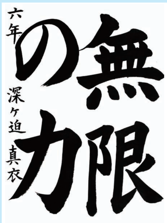
島根県・雲南市立 大東小学校6年

▼正しい筆づかいで、面も重みを感じさせた書き方には、いかにも大きく落ち着いた態度と受け取れます。スケールが大きく堂々とした貫禄を示した作品です。