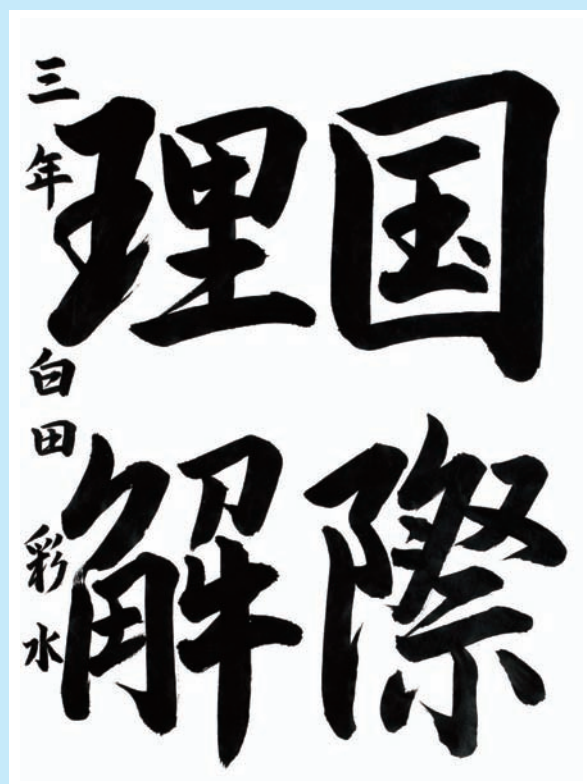
愛媛県・新居浜市立 南中学校3年

▼行書としての線をよくこなし、字形や字の配置も非常によく全体をまとめ上げました。作品として洗練され、品位を高めた感じのする作品とってよいでしょう。