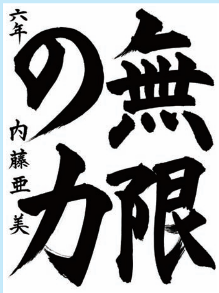
山梨県・笛吹市立一宮南小学校 6年

▼文章のように力強さをまず感じます。特に「力」はうまく書けています。名前も位置もよく、しっかり書けています。