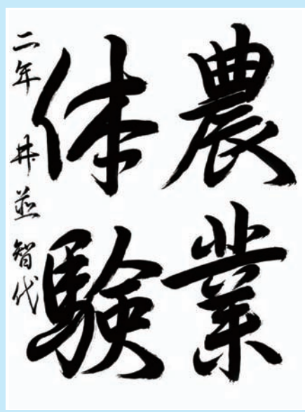
広島県・呉市立昭和北中学校2年

▼半紙に筆をおろしてから一貫した流れで書ききっている素晴らしい作品です。行書の連筆をよく理解し、筆づかいが安定してとても軽やかです。紙面に対する文字の配列も見事で余白が生きています。