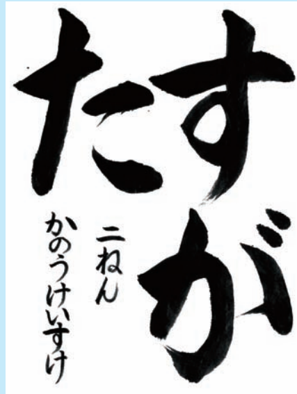
愛知県・豊山町立豊山小学校2年

▼しっかりとした筆づかいで書かれています。「す」のむすびはとても上手に筆をはこんでいます。文字を半紙いっぱいに堂々とまとめ、一生懸命書く姿が目に見えます。