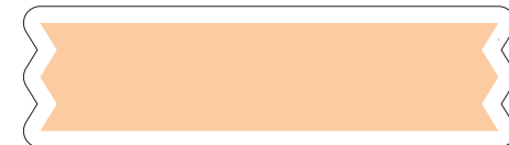
フリーテキスト おやくそくマークや きけんマークと くみあわせて あぶないことや きをつけること おうちのひとの おやくそくを かいてもらいおぼえよう