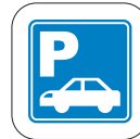
ちゅうしゃじょう くるまの かげで あそばない