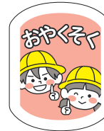
おやくそくマーク