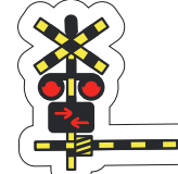
ふみきり けいほうきが なったら わたらない